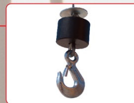
Gancho de segurança Gancho de seguridad