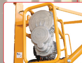
Travão de rotação Freno de rotación