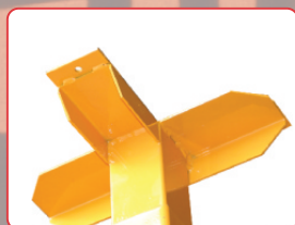
Prumo de tecto Puntal de techo