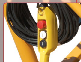
Comando de mão Mando de mano