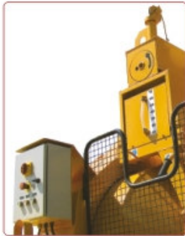
Comando e controlo Mando y control