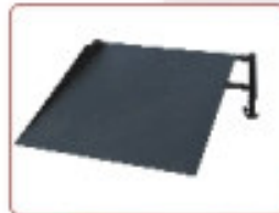
Rampa de carga Rampa de carga