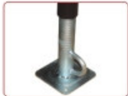
Pé ajustável Pie regulable